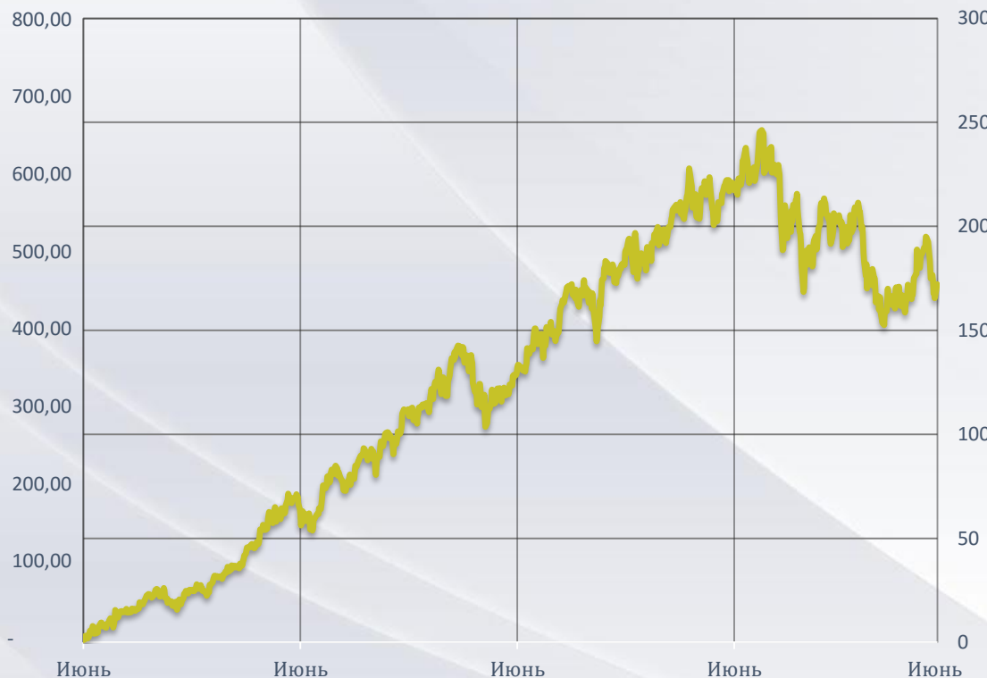
Портфель "Биотехнологии" (доходность, %)