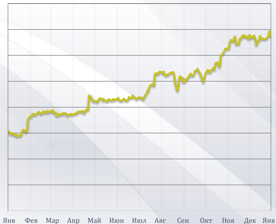
Amazon.com, Inc. (цена, USD)