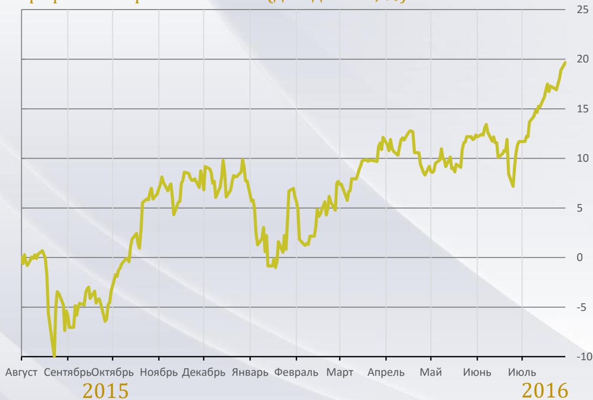
Портфель “Потребительский” (доходность, %)

ТОП 3 эмитентов: 1. Amgen Inc 2. Gilead Sciences 3. Sci Clone Pharmaceuticals